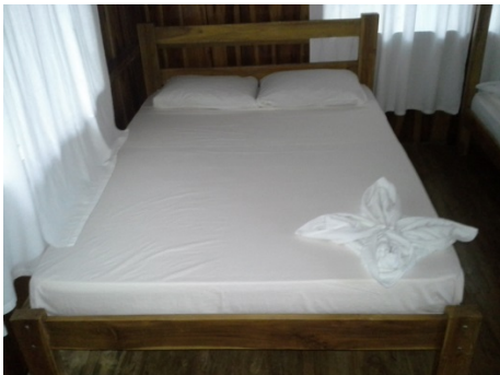
Habitación de las cabinas de la Posada Cerro Escondido