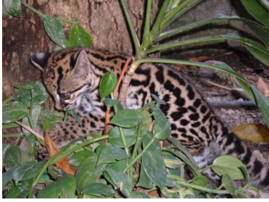
Recuperación de flora y fauna