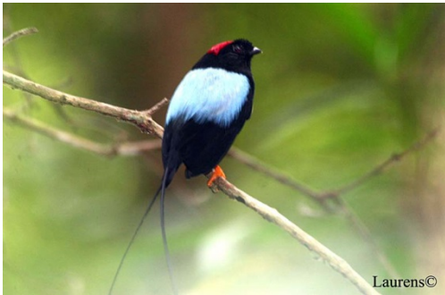
Pájaro emblemático distintivo de Asepaleco.